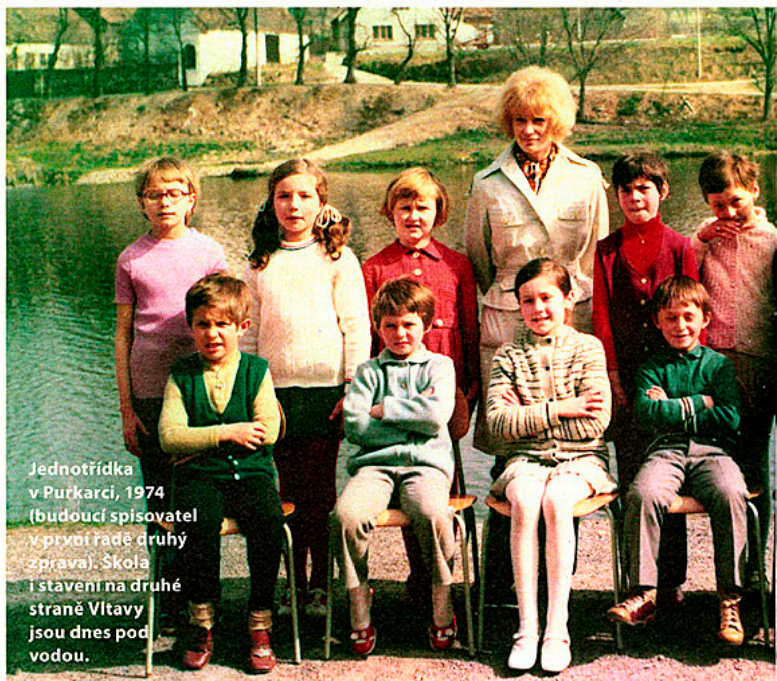
Jednotřídka v Purkarcích, 1974 (budoucí spisovatel v první řadě druhý zprava). Škola i stavení na druhé straně Vltavy jsou dnes pod vodou.

Já jsem odmala hodně a rád četl. A pak na gymplu, jako skoro každý, jsem začal psát básničky. Později jsem se dostal k povídkám – ale to už bylo na vojně, někdy v 90. letech. Jak říká Josef Škvorecký: Když